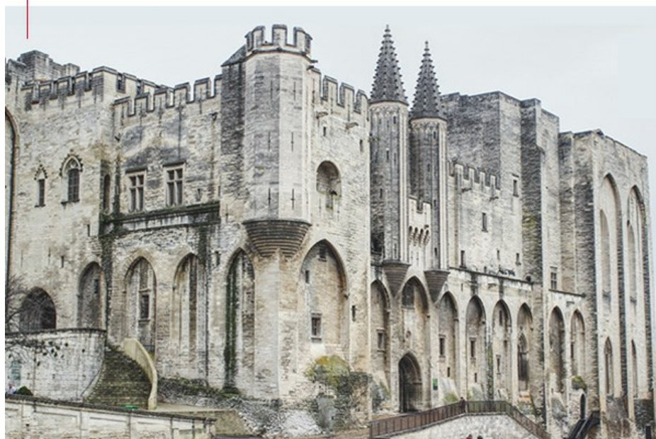
© Frédéric Barriol, Palais des Papes, Avignon, 2020